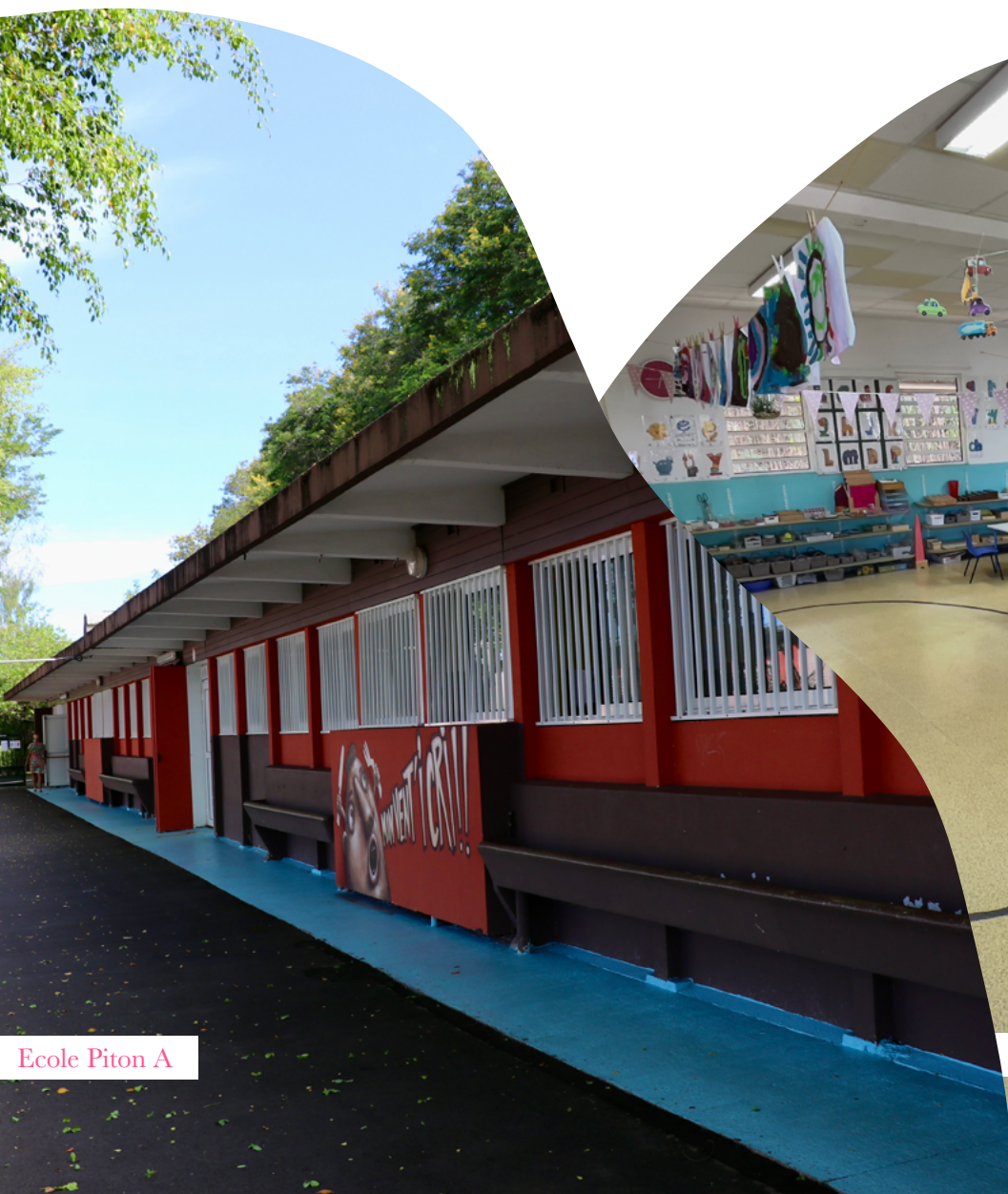
Ecole Piton A

Etablissement de programmes détaillés pour la réhabilitation : Maternelle Stella