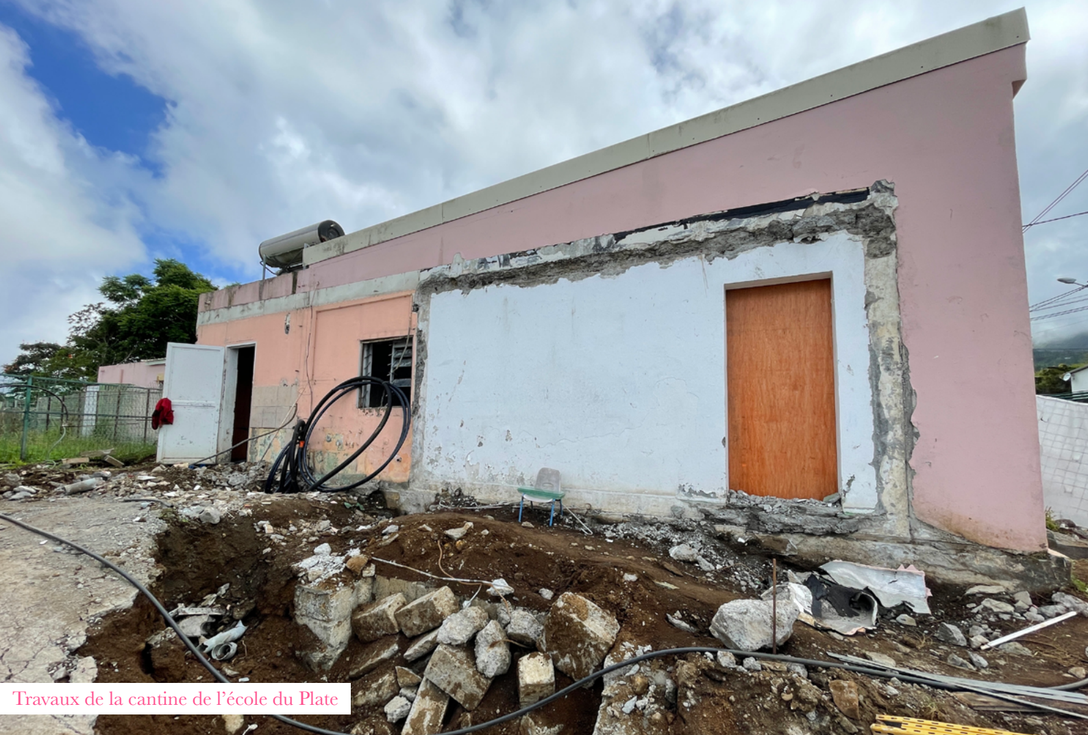
Travaux de la cantine de l'école du Plate