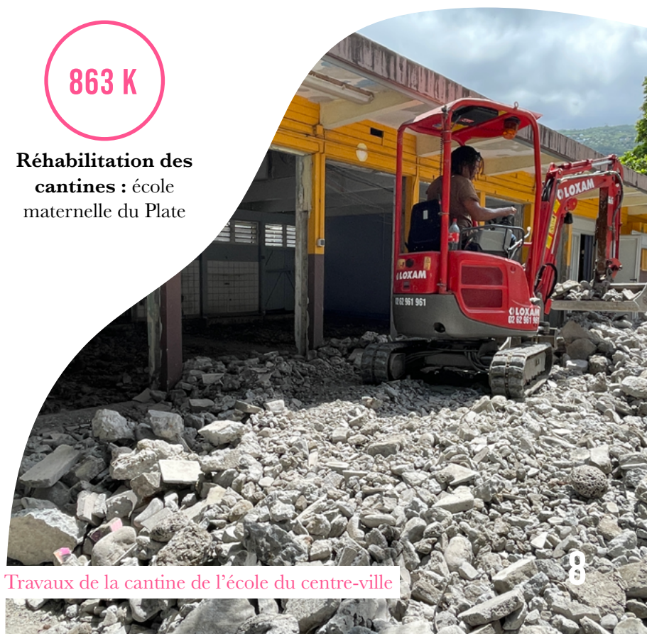
Travaux de la cantine de l'école du centre-ville