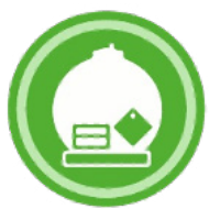
Transport de matières dangereuses et radioactives