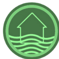
Phénomènes météorologiques, inondations